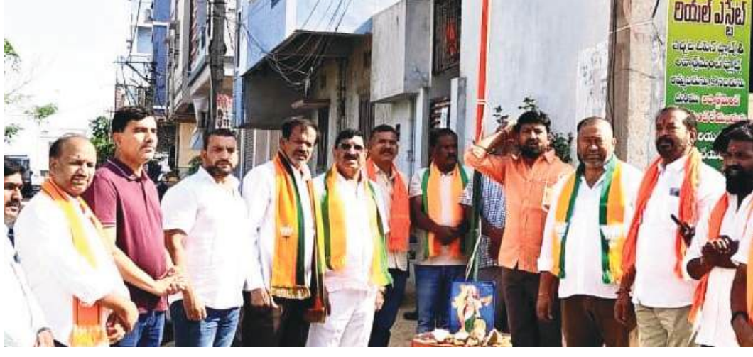
గ్రేటర్ పరిధిలో ఉన్న వివిధ డివిజన్ లలో సమస్యలు చెత్తకుప్పల పేరుకుపోయాయని గత కార్యక్రమం తాజా మాజీలు ఆయ్యారో తప్ప డివిజన్లను తాజాగా చేయలేదన్నారు. ప్రజలు ఇప్పటికైనా అర్థం చేసుకొని మోసపూరిత వాగ్దానాలిచ్చి ప్రజల్ని మోసం చేసిన కాంగ్రెస్ నాయకులను మూడు కార్యక్రమాలతో ఉన్న ప్రజలు తరిమికొట్టాలని అన్నారు.