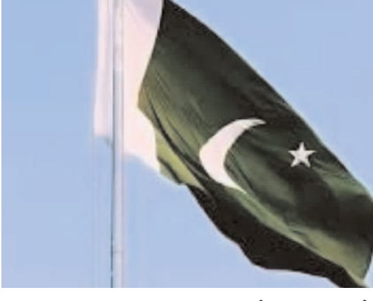
ఎదురుచూస్తున్నాయి. ఈ చర్చలు సఫలమైతే పశ్చిమాసియాలో శాంతి నెలకొంటుంది.

హై అల్టి ప్రకటించిన పాక్ ప్రభుత్వం అయితే, భేటీ దృష్ట్యా ఇస్లామాబాద్ సగరమంతా పాక్ ప్రభుత్వం హై అల్టి ప్రకటించింది. పటిష్టమైన భద్రతా ఏర్పాట్లు చేసిన అధికారులు గురువారం, శుక్రవారం రెండ్రోజులు పాటు స్థానికంగా సెలవులు ప్రకటించారు. ఇప్పటికే 30 మంది సభ్యులతో కూడిన అమెరికా భద్రతా బృందాలు ఇస్లామాబాద్ కు చేరుకొని ఏర్పాట్లను సమీక్షించాయి. అటు ఈ భేటీ కోసం ప్రపంచదేశాల అసక్తిగా