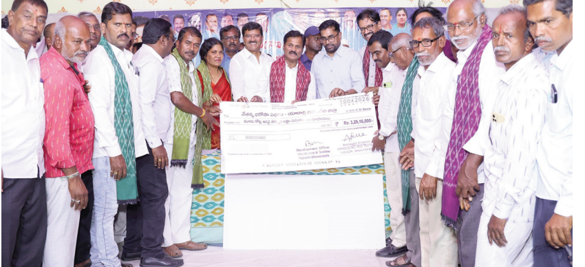
న్య పొడుపు పథకం 4081 మంది కార్మికులకు అనుబంధ కార్మికుని కి కలిపి 1.65 కోట్ల విలువల చే యడం జరిగింది. నేతన్న భీమా పథకం కింద భువన గిరి నియోజకవర్గం లోనే 14 మంది చే నేత కార్మికులకు 70 లక్షలు విలువల చే యడం జరిగింది. నేతన్న భరోసా పథకం కింద భువ నగిరి నియోజక వర్గంలోనే 4063 చేనేత కార్మికులకు మరొక అనుబంధ కార్మికులకు మూడు నెలల కు గాను 1.25 కోట్ల విలువల చే యడం జరిగింది. చేనేత ఋణ మాఫీ మిగిలిన చేనే త కార్మికులకు 163 మంది చేనేత కార్మికులకు 1.15 కోట్లు రూపాయ లు విలువల చే యడం జరిగింది.