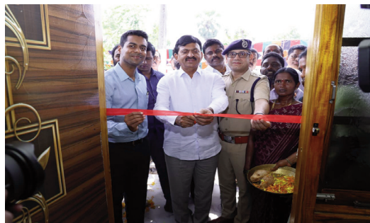
రాష్ట్ర రెవెన్యూ, హౌసింగ్, సమాచార పారసంబంధాల శాఖ మంత్రి పొంగులేటి శ్రీనివాసరెడ్డి