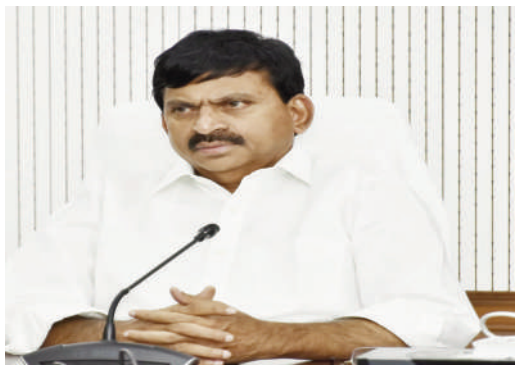
ఏడాదిలో 5కోట్లకు పైగా భూభారతి పోర్టల్