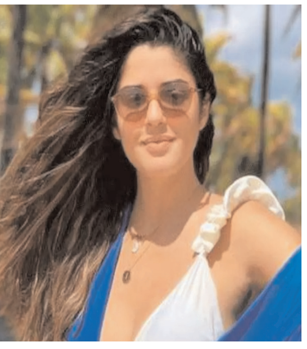
దాదాపు రెండేళ్లు కలిసి ఉన్నారు. కానీ మేము దానిని పబ్లిక్ చేయడంలేదు. కాబట్టి విరాట్ తో నాకు సంబంధం ఉంది. కానీ సిద్ధార్థ్ నాకు స్నేహితుడు మాత్రమే.. మేం కలిసి సమయాన్ని కూడా గడుపుతాము... అని విజ్ఞాపిస్తూ మాట్లాడింది.

ఓ పెన్లెంది. పురాణీ జీన్స్ లో తనూజ్ విర్యాజితో కలిసి నటించిన జాబెల్లె లైట్ అందానికి భారతీయులు ఫిదా అయిపోయారు. కాలక్రమంలో కరణ్ జోహార్ కాఫీ షోలో ఇజబెల్లా ప్రత్యక్షమైంది. విరాట్ తో స్నేహాన్ని ఈ బ్యూటీ ఖండించలేదు. అలాగే సిద్ధార్థ్ మల్హోత్రా స్నేహితుడు అని కూడా తెలిసింది. ఇప్పటికీ తాము కలుస్తుంటామని వెల్లడించింది. నా మగ స్నేహితుల మీద ఈ రకమైన క్రధ .. ఇప్పటికీ మూడు అనుభవాలతో ముడిపడి ఉన్నాయి. కానీ నేను చాలా ఇబ్బందిగా భావిస్తున్నాను. నేను నా పని గురించి తప్ప ప్రతికోటా కనిపించాలని వినిపించాలని కోరుకునే అమ్మాయిని కాదు... అని తెలిపింది. ఇజబెల్లా తన జీవితంపై మీడియా అసత్యాలు రాసిందని వాపోయింది. మీడియాలోని కొన్ని వర్గాలు నా గురించి చాలా ఎక్కువ ప్రచారం చేసాయి. ఆ పుకార్లే నిజాలు కావు... పరచారేమో... నేను ఈ వృత్తిలో ఉన్నాను. అక్కడ ప్రజలు నా జీవితం గురించి ఆసక్తిగా ఉంటారు. ఇది నా పనిలో భాగం కాబట్టి నేను అర్థం చేసుకున్నాను... అని అన్నారు. తొలి చిత్రం పురాణీ జీన్స్ సహనటుడు తనున్ విర్యాజితో లింక్-అప్ పుకార్లు కూడా ఉన్నాయి. కానీ వాటిని ఇజబెల్లా ఖండించింది. తనుజ్ నా సహనటుడు.. మేము పురాణీ జీన్స్ కోసం పర్మిషన్ లను ప్రారంభించినప్పటి నుండి నిజంగా మంచి స్నేహితులం అయ్యాము. మేం ఎల్లప్పుడూ ఒకరినొకరు కలుస్తాము. అతని తల్లిదండ్రులు కూడా నాకు తెలుసు. వారు నాకు చాలా మంచి కుటుంబం వంటి వారు. అంతకు మించి ఏదీ లేదు అని తెలిపింది. క్రికెటర్ విరాట్ కోహ్లాతో డేటింగ్ చేస్తున్నట్లు ఇజబెల్లా అంగీకరించింది. నేను ఇండియా వచ్చినప్పుడు నా మొదటి భారతీయ స్నేహితుల్లో విరాట్ ఒకడు. మేము చాలా కాలం పాటు డేటింగ్ చేసాము.