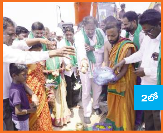
2లో మక్తల్ -నారాయణపేట - కొడంగల్ ఎత్తిపోతల పథకాన్ని యుద్ధ ప్రాతిపదికన పూర్తి చేస్తాం

హైదరాబాద్, విజయవాడ సోమవారం 20-04-2026 పేజీలు : 6