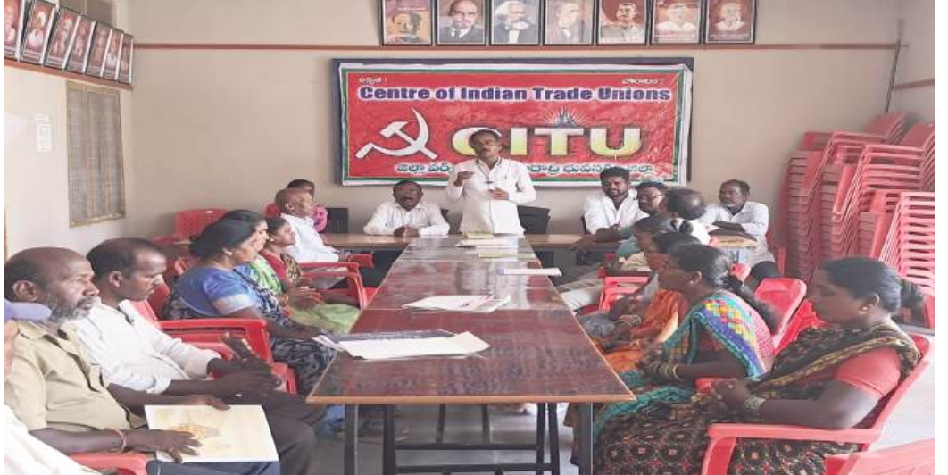
యాదాద్రి భువనగిరి, తెలంగాణ న్యూస్: మేడే వారోత్సవాలను అన్నిరంగా ల వారు కలిసి నిర్వహించాలని అధిక సంఖ్యలో