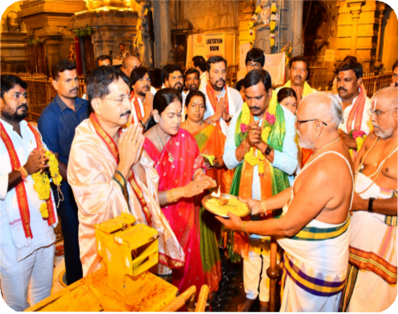
యాదాద్రి భువనగిరి, తెలంగాణ స్వామి: