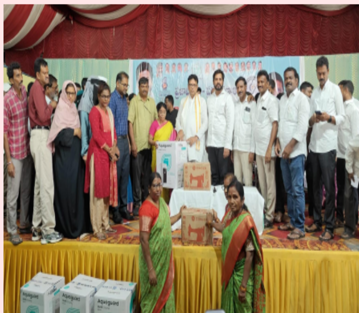
తెహల్యా మే 6: