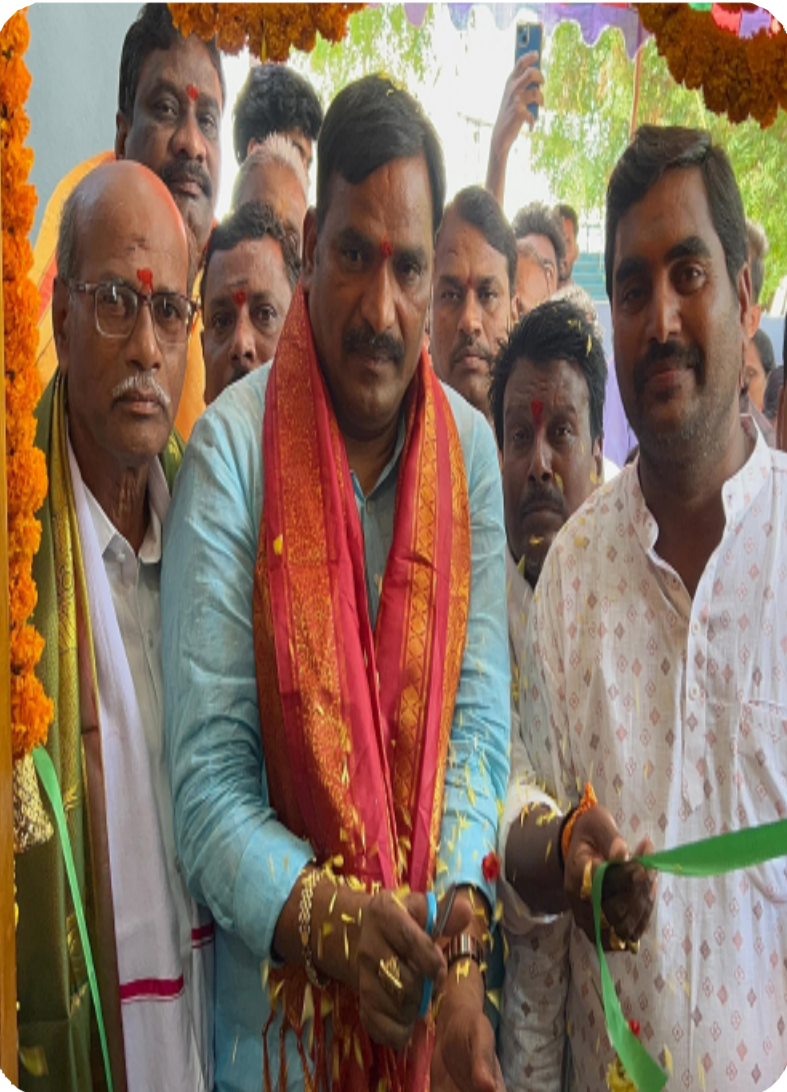
యాదాద్రి భువనగిరి, తేహెల్సా స్టూన్స్:

మండలం మాసాయిపేట, కంటం గూడెం, పెద్ద కందుకూరు గ్రామాల్లో నూతనంగా నిర్మించిన ఇందిరమ్మ ఇల్లు గృహప్రవేశ కార్యక్రమంలో తెలంగాణ రాష్ట్ర ప్రభుత్వవిప్, ఆలేరు ఎమ్మెల్యే బీర్ల ప్రభుత్వం పేదల సంక్షేమాన్ని లక్ష్యంగా పెట్టుకుని