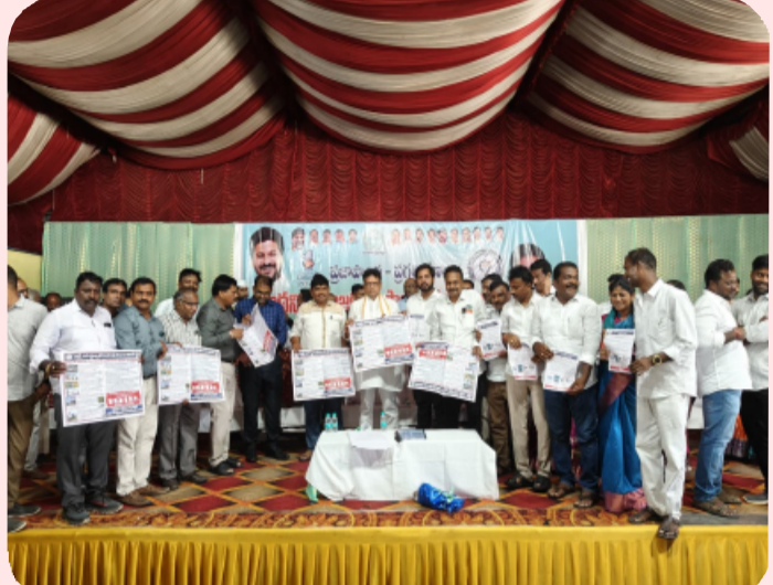
తెలంగాణ గంగాపురి (మంథని):