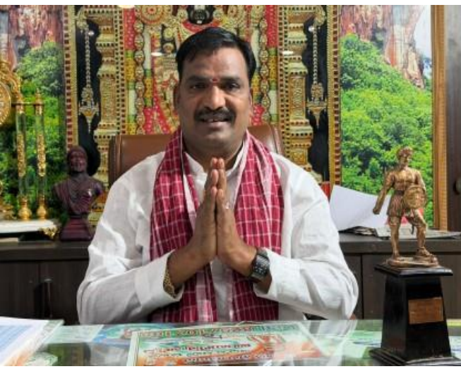
సారి రాష్ట్ర ప్రభుత్వానికి, ముఖ్యమంత్రికి, మంత్రివర్గానికి ఎమ్మెల్యే జిర్ల అయిలయ్య హృదయపూర్వక కృతజ్ఞతలు తెలిపారు.

కురుమ కార్పొరేషన్ ఏర్పాటుచేయడం ప్రభుత్వ చిత్తశుద్ధికి నిదర్శనమన్నారు. కురుమ అభివృద్ధి, సంక్షేమం, ఆర్థిక పురోగతిని దృష్టిలో పెట్టుకొని తీసుకున్న ఈ నిర్ణయం సమాజానికి కొత్త నమ్మకాన్ని ఇచ్చిందన్నారు. అలాగే కురుమ సమాజానికి సేవ చేసిన నాయకుడిని త్వరలోనే కార్పొరేషన్ చైర్మన్ గా నియమిస్తామని ప్రభుత్వం ప్రకటించడం మరింత ఆనందాన్ని కలిగించిందని తెలిపారు. ఈ ప్రజాప్రభుత్వం అన్ని కులాలను సమానంగా గౌరవిస్తూ బీసీల అభివృద్ధికి పెద్దపీట వేస్తూ సామాజిక న్యాయం దిశగా ముందుకు సాగుతోందని ఎమ్మెల్యే జిర్ల అయిలయ్య కొనియాడారు. కురుమ సమాజం తరపున మరో