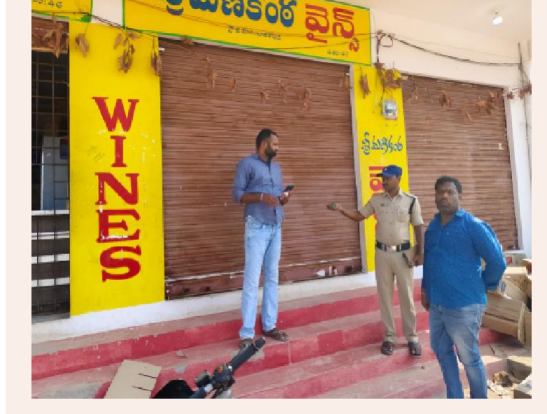
చారకొండ, మే 07:

నాగర్ కర్నూలు జిల్లా చారకొండ మండల కేంద్రంలో మధ్య విక్రయాల తీరు వివాదాస్పదంగా మారింది. వైస్ యజమానులు సిండికేట్ గా మారి సామాన్య వినియోగదారులకు ఇబ్బంది కల్పిస్తున్నారంటూ ఆందోళన వ్యక్తం చేశారు. నిబంధనలకు విరుద్ధంగా ఒక వైస్ కు కేవలం బెల్ట్ షాపులకే పరిమితం చేయడంతో స్థానికులు ఆగ్రహం వ్యక్తం చేస్తూ గురువారం వైస్ కు తాళం వేశారు.