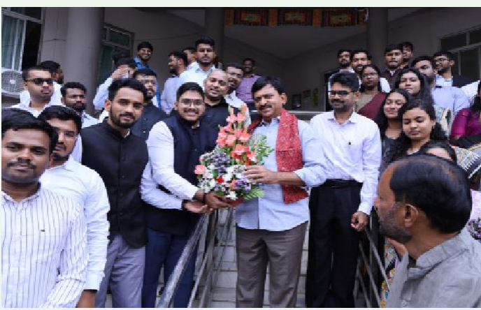
తేలంగా హైదరాబాద్ :

-ప్రొవైడెన్సీ డిప్యూటీ కలెక్టర్లకు మంత్రి పొంగులేటి శ్రీనివాసరెడ్డి పిలుపు