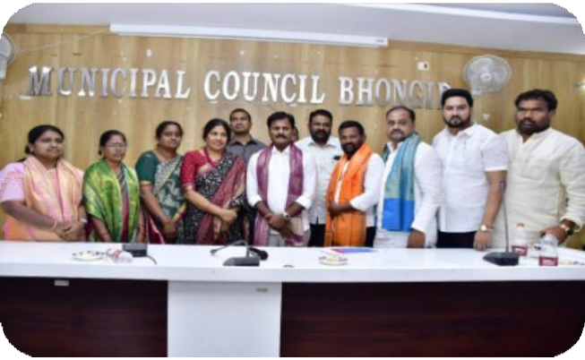
ఈ కార్యక్రమంలో మున్సిపల్ చైర్ పర్సన్, వైస్ చైర్ పర్సన్, కౌన్సిలర్లు, మున్సిపల్ కమిషనర్, ప్రజాప్రతినిధులు, నాయకులు తదితరులు పాల్గొన్నారు.

భుత్వం ప్రతిష్టాత్మకంగా అమలు చేస్తోందని పేర్కొన్న ఆయన, మూసి నదిపై రూ.50 కోట్ల వ్యయంతో బ్రిడ్జి మంజూరైందన్నారు. అలాగే జూలూరు, అనాజీపురం, శివారెడ్డి గూడెం ప్రాంతాలకు సంబంధించిన బ్రిడ్జిల నిర్మాణ పనులు కూడా ప్రజాపాలనలో భాగంగా చేపడు తున్నట్లు తెలిపారు. అనంతరం మున్సిపల్ కౌన్సిల్ సమావేశంలో పలు అభివృద్ధి అంశాలపై చర్చించి కో-ఆప్షన్ సభ్యుల ఎన్నిక ప్రక్రియను నిర్వహించారు. ఈ సందర్భంగా కొత్తగా ఎన్నికైన కో-ఆప్షన్ సభ్యులకు ఎమ్మెల్యే శుభాకాంక్షలు తెలియజేశారు.