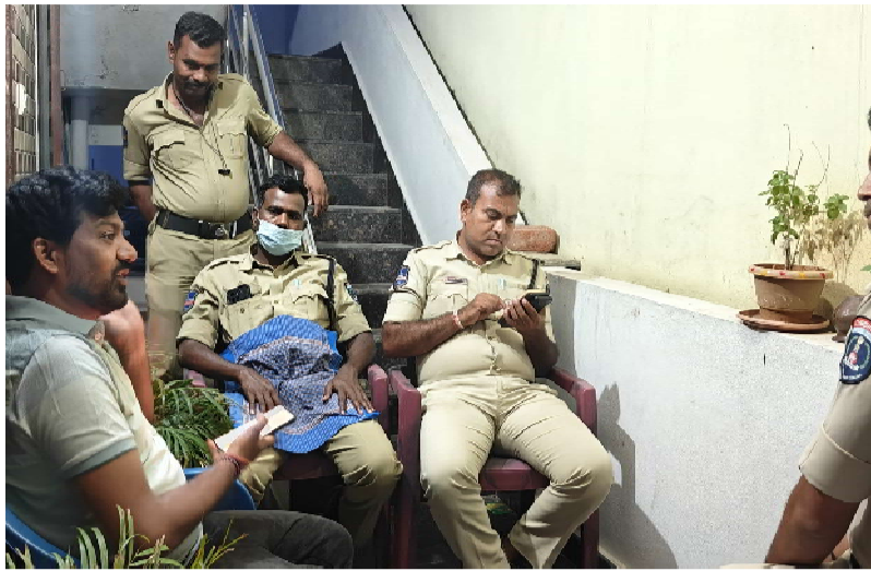
హిందువుల మనోభావాలను కాపాడాల్సిన బాధ్యత గల రాష్ట్ర ప్రభుత్వం ఒకే వర్గానికి కొమ్మకాస్తూ వారి ఆగడాలను సమర్థించడం సరైనది కాదన్నారు.

ఎంతవరకు కఠిన్ అని ప్రశ్నించారు. హిందువులైనా, ఎంఐఎం నాయకులైనా చట్టం ఒకే విధంగా ఉండాలని అన్నారు. గోవుల అక్రమ రవాణా చేస్తూ బహిరంగంగా తిరుగుతున్న వారిపై వెంటనే కేసులు పెట్టాలని అన్నారు. గోమాతను కాపాడాలని వెప్పే ప్రభుత్వం అక్రమ రవాణాను ఎందుకు అపదం లేదని హిందువుల తరుపున ప్రశ్నిస్తున్నారన్నారు. ఎవరైనా చట్టాన్ని ఉల్లంఘిస్తే వారిపై కఠిన చర్యలు తీసుకోవాలన్నారు.