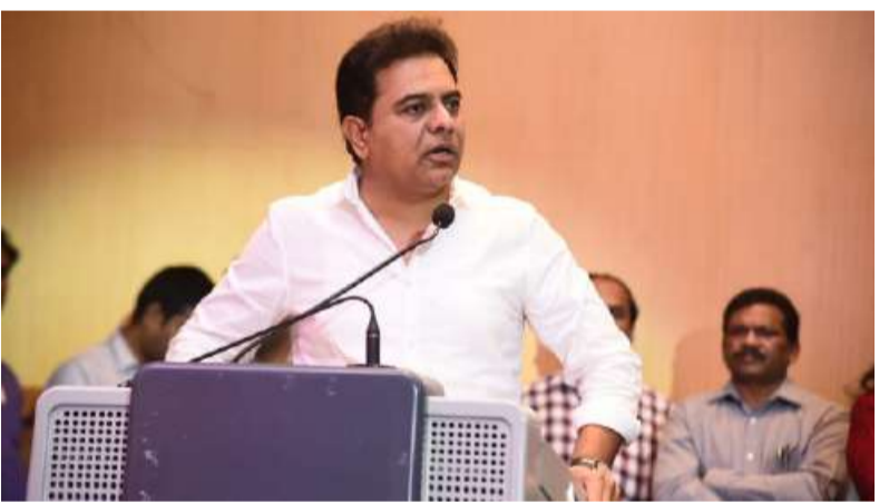
-బీసీపిల స్నాతకోత్సవ కార్యక్రమంలో పాల్గొన్న కేటీఆర్ -చార్జర్డ్ అకౌంటెంట్లు కేవలం పన్నుల లెక్కలకే పరిమితం కాకుండా సూచన -సీపిలు వ్యాపారాలను వృద్ధి చేసే సలహాదారులుగా నిడగాలని ఆకాంక్ష తెలంగాణలో కొనసాగుతున్న తీవ్రమైన ఎండలు, వడగాలులు వడదెబ్బ కారణంగా -రాష్ట్రవ్యాప్తంగా 34 మంది వృద్ధి -కుటుంబ ధీం జిల్లాలో రికార్డు స్థాయిలో 46.5 డిగ్రీల ఉష్ణోగ్రత నమోదు -18 జిల్లాలకు వాతావరణ శాఖ రెడ్ అలర్ట్ జారీ రానున్న నాలుగు రోజులు అప్రసవంగా ఉండాలని హెచ్చరిక