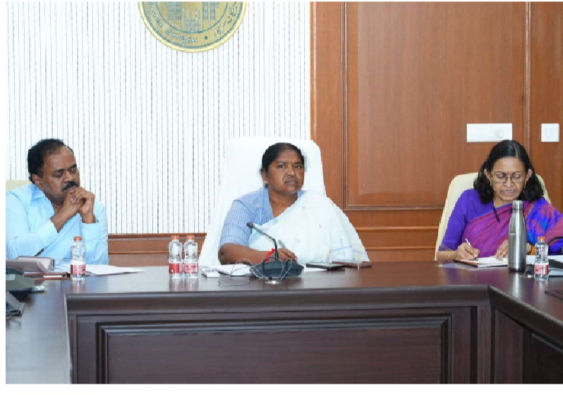
ప్రజా పాలన ప్రగతి ప్రణాళికలో భాగంగా ఈ నెల 25 నుంచి 31వ తేదీ వరకు రాష్ట్రవ్యాప్తంగా నిర్వహించనున్న