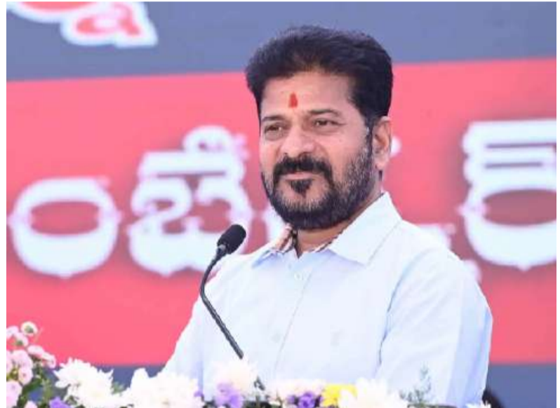
తెలంగాణ ప్రభుత్వం నిర్ణయించింది. ఈ మేరకు ముఖ్యమంత్రి రేవంత్ రెడ్డి అధ్యక్షతన సమావేశమైన మంత్రివర్గం సంబంధిత పనుల కోసం నిధుల కేటాయింపునకు ఆమోదం తెలిపింది. తొలి విడతగా రూ.800 కోట్ల మంజూరుకు పచ్చజెండా ఊపింది. 2లో..

-కేబినెట్ సమావేశంలో పలు కీలక నిర్ణయాలు -రేవంత్ రెడ్డి అధ్యక్షతన మంత్రివర్గం భేటీ -తొలి విడతగా రూ.800 కోట్ల మంజూరుకు కేబినెట్ పచ్చజెండా