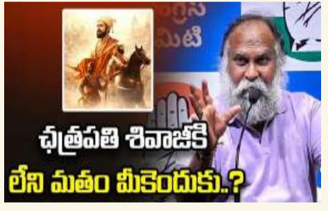
చక్రపతి శివాజీకి లేని మతం మీకెందుకు? అని అడిగితే ఎవరూ ఏం చేయలేరని అన్నారు.