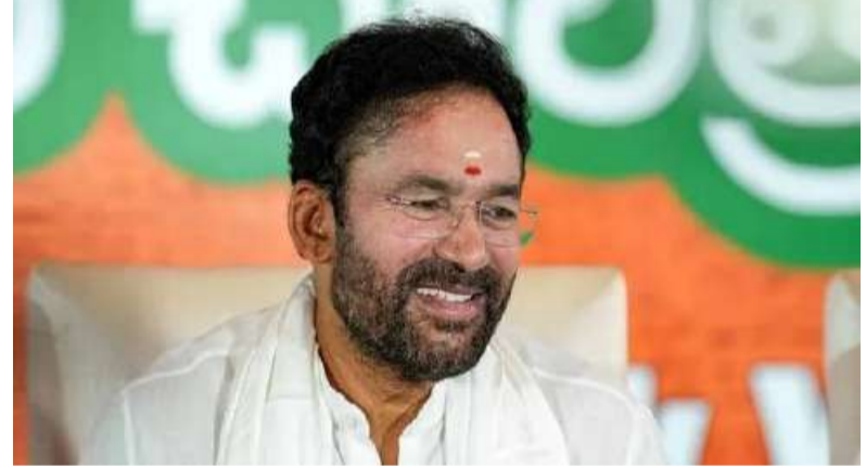
దేశవ్యాప్తంగా 47 ప్రాంతాల్లో జరిగిన రోజ్ గార్డ్ మేళాలో 51 వేల మందికి కేంద్ర ప్రభుత్వ ఉద్యోగాలు ఇచ్చామని కేంద్ర మంత్రి కిషన్ రెడ్డి తెలిపారు. శనివారం బోయిగూడ లోని రైల్వే కళాశాలలో జరిగిన 19వ రోజ్ గార్డ్ మేళాలో కేంద్ర మంత్రి పాల్గొని ప్రసంగించారు. ఈరోజు 220 మంది కొత్తగా ఉద్యోగాల్లో